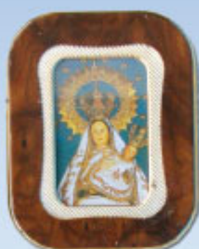
10/172 4 modelos