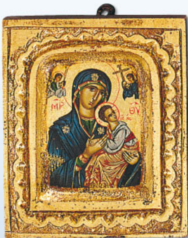
OO SK (10 x 13 cm)