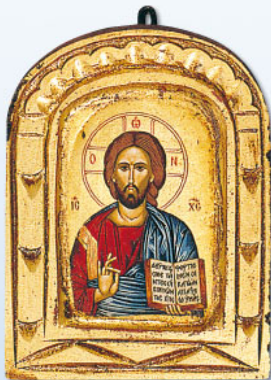
OO S (10 x 13 cm)