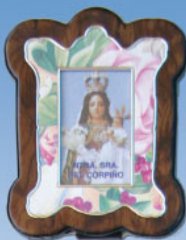
10/240F 3 modelos