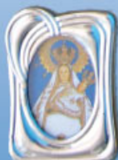
10/02980 4 modelos