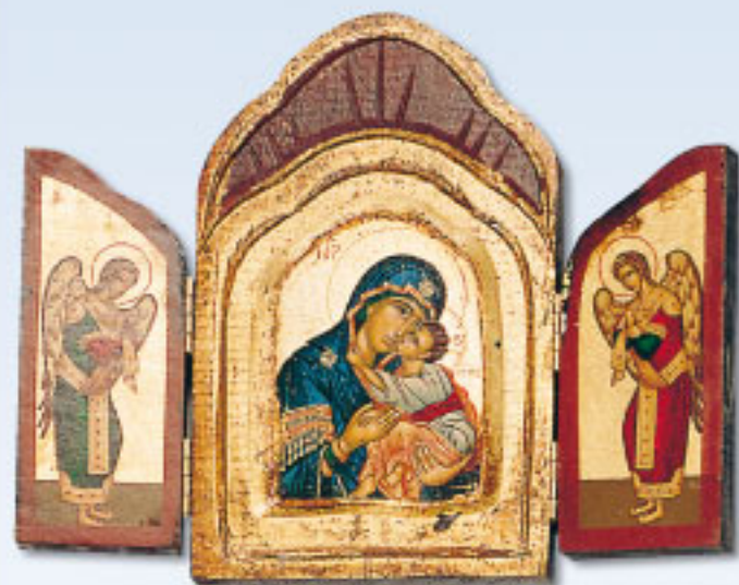
OTRE 1 (15 x 19 cm)