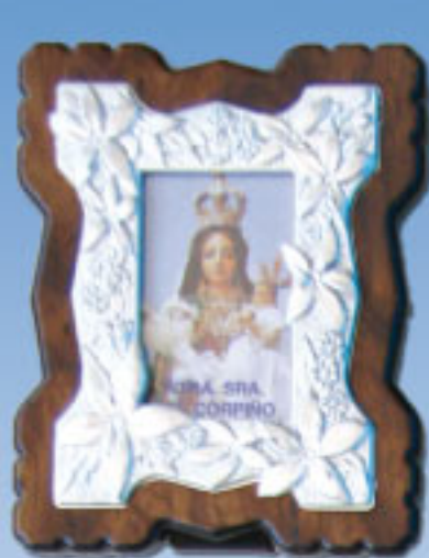
10/240A 3 modelos