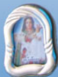
10/02981 4 modelos