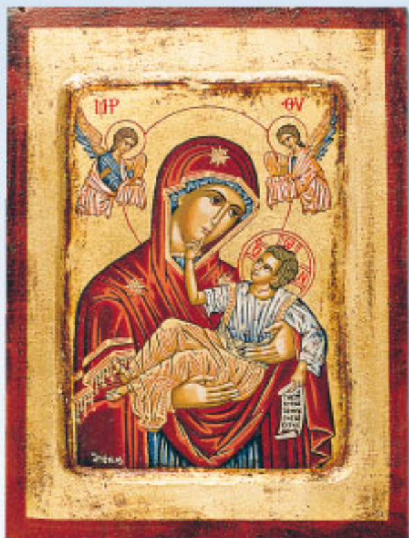
IS (18 x 24 cm)